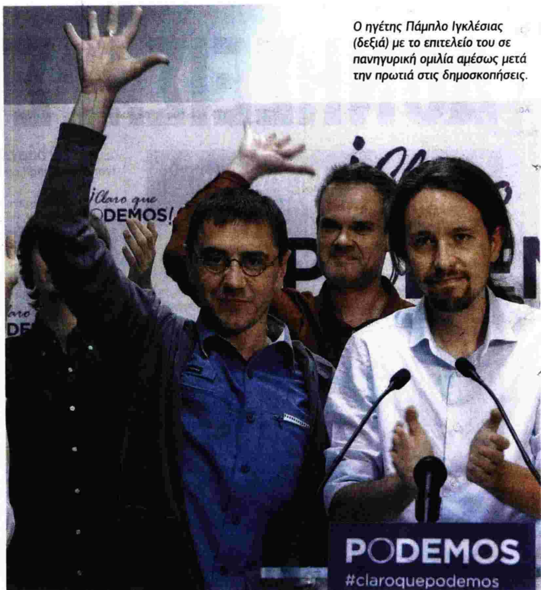
Ο ηγέτης Πάμπλο Ιγκλέσιας (δεξιά) με το επιτελείο του σε πανηγυρική ομιλία αμέσως μετά την πρωτιά στις δημοσκοπήσεις.

ΕΠΙΠΡΟΣΞ. Το «Podemos» έχει άμεσες επιρροές από τη βολιβιανή Αριστερά ως προς τη στρατηγική του, ενώ οι ηγέτες του «ρέπουν προς τον τσαβισμό», έγραψε πρόσφατα στο Reuters ο Hugo Dixon, και δικαιολογημένα. Το κόμμα μιλά για αναδιάρθρωση του χρέους, για 35 ώρες εργασίας, σύνταξη στο 60ό έτος, απαγόρευση των απολύσεων σε κερδοφόρες επιχειρήσεις, μείωση των προνομίων της Καθολικής Εκκλησίας και διευρυμένη πρόσβαση των πολιτών στα δημόσια αγαθά της υγείας και της παιδείας. Ομως πόσο εφικτά μπορεί να είναι σήμερα όλα όσα ο χαρισματικός ηγέτης του «Podemos», Πάμπλο Ιγκλέσιας, οραματίζεται; Σύμφωνα με τον Dixon, καθόλου. «Αν όλα αυτά γίνουν κυβερνητική πολιτική -αναφέρει ο έγκριτος αναλυτής-, μπορεί να οδηγήσουν τη χώρα στη χρεοκοπία και στην έξοδο από την ευρω-