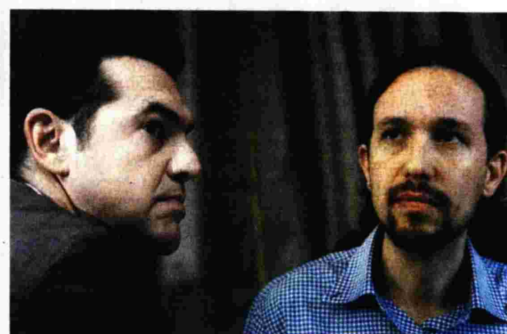
Από την πρόσφατη συνάντηση του Αλ. Τσίπρα με τον Π. Ιγκλέσιας.