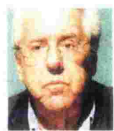
ΤΟΥ ΓΙΑΝΝΗ ΒΟΥΛΓΑΡΗ

Το διπλό αδιέξοδο ήταν αναμενόμενο. Και δεν είναι συγκυριακό. Δεν αφορά την τρόικα, την αξιολόγηση ή τις διενέξεις επί του «δημοσιονομικού κενού». Η εμπλοκή είναι δομική και πολιτική. Θεωρώντας την Ελλάδα μαύρο πρόβατο και βλέποντας ότι έχει εισέλθει σε μια μεσοπρόθεσμη φάση πολιτικής αστάθειας, οι ηγεσίες