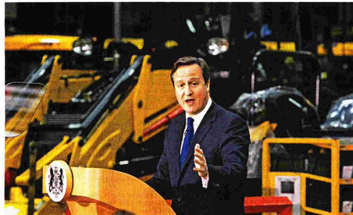
Ο Ντέιβιντ Κάμερον στην ομιλία του στην καρδιά της βιομηχανίας JCB. Ο Βρετανός πρωθυπουργός αναφέρθηκε εκτενώς στους ευρωπαίους μετανάστες. Αυτό που βλέπει είναι να «μεταναστεύουν» οι συντηρητικές ψήφοι στο UKIP

Η Βρετανία δέχεται περισσότερους μετανάστες από τις χώρες εκτός ΕΕ παρά από ευρωπαϊκές χώρες. Οι δεύτεροι είναι πολύ πιο πιθανό να επιστρέψουν στις χώρες καταγωγής τους