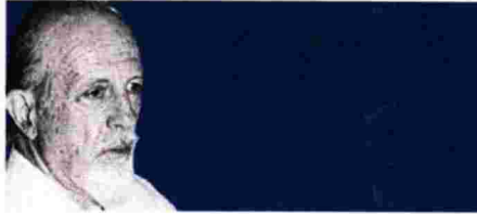
Θεοδόσης II. Τάσιος