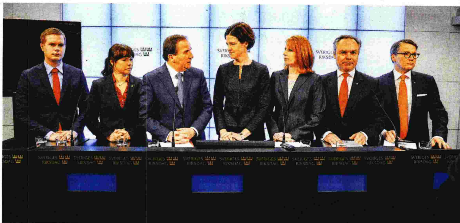
Πλαισιωμένοι από τους ηγέτες ή εκπροσώπους των Πρασίνων, των κυβερνητικών του εταίρων καθώς και της κεντροδεξιάς Συμμαχίας, ο Σοσιαλδημοκράτης πρωθυπουργός της Σουηδίας Στέφαν Λέβεν (τρίτος από αριστερά) ανακοινώνει τη ματαίωση των πρόωρων εκλογών

κυβέρνηση που σχηματίστηκε όμως, η πρώτη κυβέρνηση συνασπισμού Σοσιαλδημοκρατών - Πρασίνων στην ιστορία της Σουηδίας, ήταν και μία από τις πιο αδύναμες στην ιστορία της. Μόλις δύο μήνες μετά τις εκλογές, λοιπόν, ο πρωθυπουργός Στέφαν Λέβεν αναγκάστηκε να προκηρύξει πρόωρες εκλογές για τον ερχόμενο Μάρτιο, τις πρώτες πρόωρες εκλογές της Σουηδίας από το 1958. Διότι το σχέδιο προϋπολογισμού που κατέθεσε η κυβέρνησή του, με αυξήσεις φόρων για τους πλουσιότερους και αντίστοιχη αύξηση των δαπανών για το κράτος πρόνοιας, την παιδεία και την απασχόληση, καταψηφίστηκε τόσο από τα τέσσερα κόμματα της κεντροδεξιάς Συμμαχίας όσο και από τους Σουηδούς Δημοκράτες – οι οποίοι έλαβαν ποσοστό 12,9% στις εκλογές του Σεπτεμβρίου, έγιναν