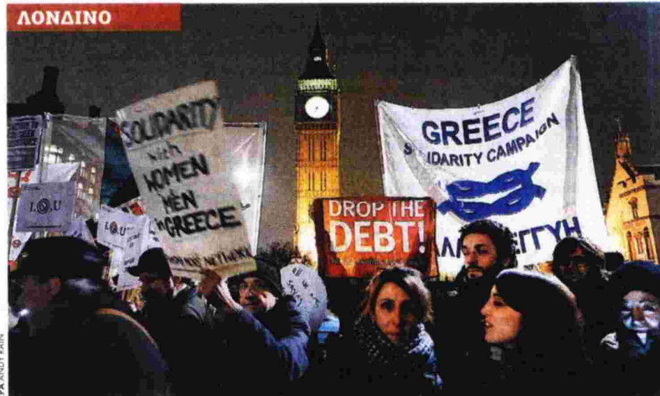
Το ραντεβού δόθηκε έξω από τη Βουλή των Κοινοτήτων. Οι διαδηλωτές εξέφρασαν την αλληλεγγύη τους με φόντο το Μπιγκ Μπεν και απηφώντας το τσουχτερό κρύο