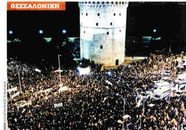
ΘΕΣΣΑΛΟΝΙΚΗ Χιλιάδες ήταν οι διαδηλωτές που συγκεντρώθηκαν στον Λευκό Πύργο για να εκφράσουν τη στήριξή τους στην κυβέρνηση

Οι μεγαλύτερες συγκεντρώσεις ήταν στο Σύνταγμα και στον Λευκό Πύργο και οργανώθηκαν μέσω κοινωνικών δικτύων, χωρίς να μετέχουν επίσημοι φορείς