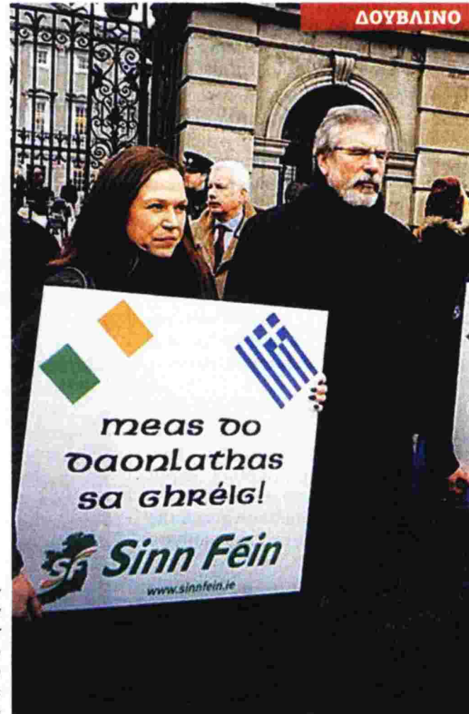
Ο επικεφαλής του Σιν Φέιν Τζέρι Ανταμς ανέβασε στον λογαριασμό του στο twitter φωτογραφία με τον ίδιο και άλλους Ιρλανδούς στη συγκέντρωση αλληλεγγύης στο Δουβλίνο