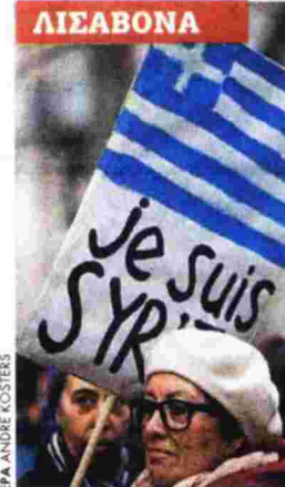
«Είμαι ΣΥΡΙΖΑ» γράφει το πλακάτ με την ελληνική σημαία που κρατάει μια διαδηλώτρια στη Λισαβόνα μπροστά από την έδρα της αντιπροσωπείας της Κομισιόν

Στη Ρώμη, οι πολίτες ανταποκρίθηκαν στο μήνυμα «Η Αθήνα καλεί, η Ευρώπη απαντά: Κινητοποίηση στη Ρώμη».