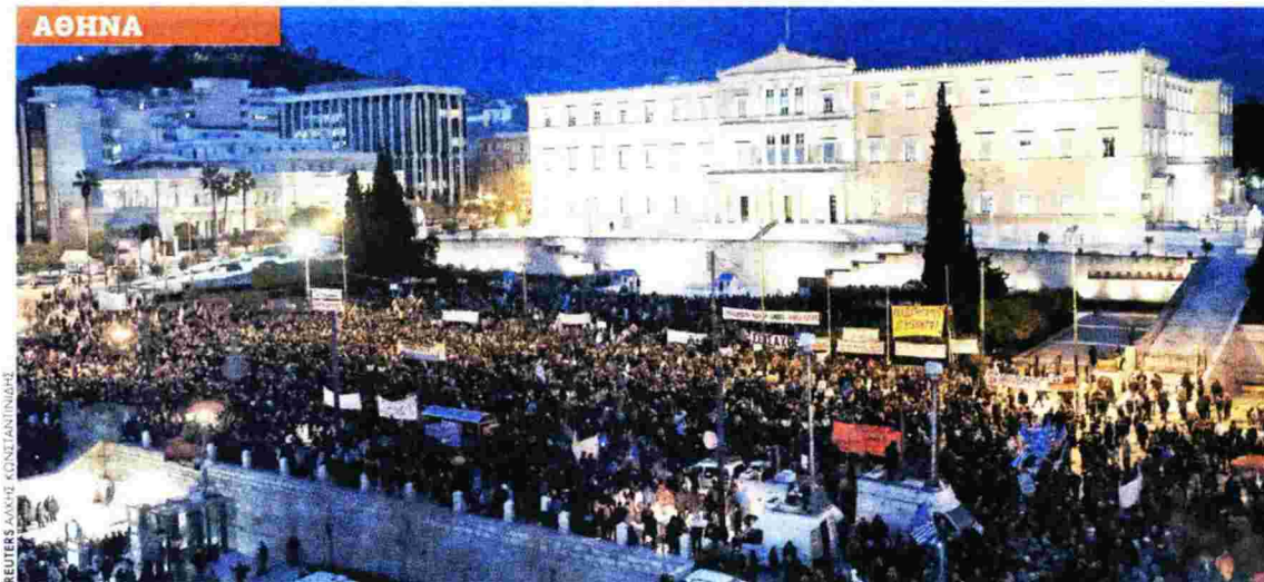
ΑΘΗΝΑ Το τσουχτερό κρύο και η ασθενής χιονόπτωση δεν κατάφεραν να πτοήσουν τους περισσότερους από 15.000 Αθηναίους, οι οποίοι έδωσαν το «παρών» κατακλύζοντας την Πλατεία Συντάγματος