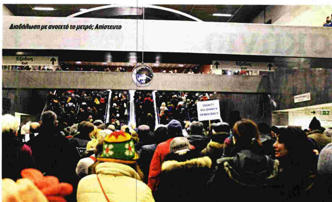
Αδιεξήγητη η καθημερινότητα της πόλης