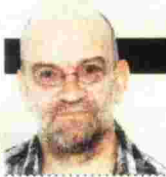
ΓΡΑΦΕΙΟ ΗΛΙΑΣ ΚΑΝΕΛΛΗΣ

Στο νέο του βιβλίο, ο πολιτικός αναλυτής και επικοινωνιολόγος εξηγεί πώς γκρεμίστηκαν τα κυρίαρχα κόμματα της Μεταπολίτευσης