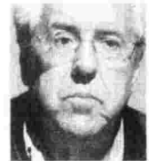
ΤΟΥ ΓΙΑΝΝΗ ΒΟΥΛΓΑΡΗ

■ Το «ψέμα της επιστροφής» στα προ της κρίσης κεκτημένα παίχθηκε σαν υπόσχεση από όλες τις αντιπολιτεύσεις. Σήμερα παίζεται από τον ΣΥΡΙΖΑ. Από την αρχή της κρίσης ο ΣΥΡΙΖΑ κινήθηκε στη γραμμή ενός «ριζοσπαστικού συντηρητισμού». Μιας μαχητικής, πολωτικής, σχεδόν εμφυλιοπολεμικής υπεράσπισης του υπάρχοντος, ακόμα και όταν ήξερε ότι η διατήρηση ήταν ανέφικτη. Η εκλογική επιτυχία και η ανάδειξή του σε διεκδικητή της εξουσίας έχουν μεταφράσει τη γραμμή του «ριζοσπαστικού συντηρητισμού» σε μια παραδοσιακότετη αντιπολιτευτική στάση «όχι σε όλα», «υιοθετώ κάθε αίτημα», «να πάρω την εξουσία και μετά βλέπουμε». Παράδοξη, μα την αλήθεια, τροχιά από τον «αντισυστημικό κινηματισμό» του αρχικού ΣΥΡΙΖΑ στον κλασικό αντιπολιτευτικό λαϊκισμό που ενδημεί στην ελληνική πολιτική. Όπως και να 'χει, ο ΣΥΡΙΖΑ από το 2012 αποτελεί τον εκφραστή του σκελετωμένου πια κορμού του