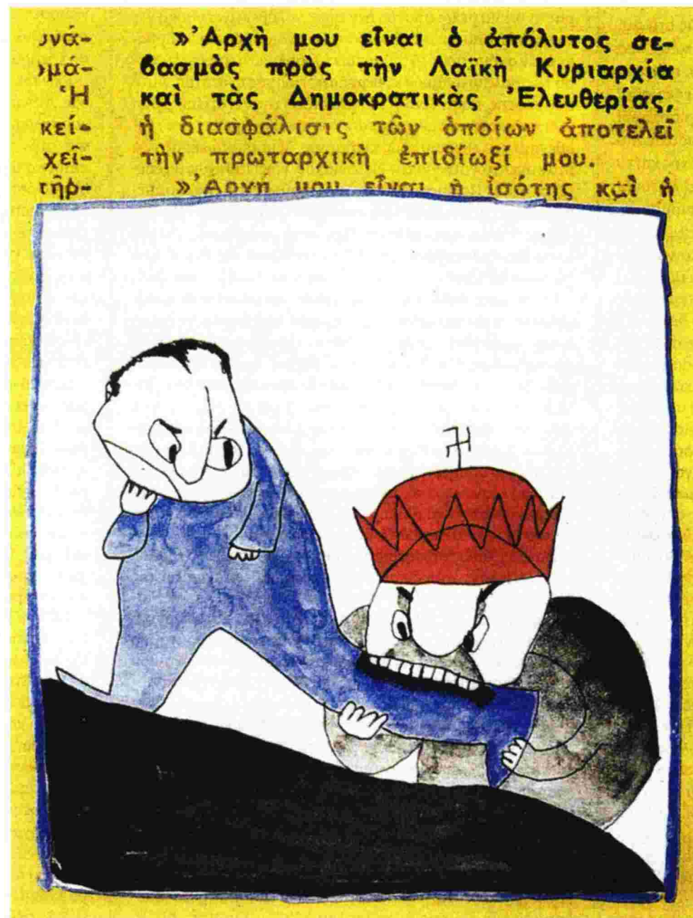
Αφίσα του Αλέξη Κυριακόπουλου για το δημοψήφισμα του 1974

Φυσικά, σε κάθε αρχιτεκτονικό αριστούργημα υπάρχει μια ενοχλητική λεπτομέρεια. Στην περίπτωση μας, αυτή σχετίζεται με τις πολιτικές των κυβερνήσεων του Κωνσταντίνου Καραμανλή αμέσως μετά τις εκλογές του 1974. Οι εθνικοποιήσεις, ο οικονομικός παρεμβατισμός και η έξοδος της χώρας από το στρατιωτικό σκέλος του ΝΑΤΟ συνιστούν μια ενοχλητική κληρονομιά του ιστορικού ηγέτη της ελληνικής Δεξιάς, ο οποίος θα μπορούσε άνετα να χαρακτηριστεί από τους αρθρογράφους της σύγχρονης Καθημερινής ως ο «Έλληνας Τσάβες». Αντιμέτωπος με το πρόβλημα της «σοσιαλμανίας» του εθνάρχη, ο Α. Σαμαράς καταφεύγει αρχικά σε μια νοηματικά ασταθή και ελαφρώς ασύντακτη γενικότητα —«και ένα άλμα προς τα εμπρός συχνά κρύβει και τα σπέρματα μιας μεγάλης κρίσης που θα ξεσπούσε αργότερα»— πριν αναγορεύσει τον Καραμανλή σε πολέμιο του λαϊκισμού και αποδώσει τη γιγάντωση του κρατισμού σε μια ακαθόριστη μετακαραμανλική περίοδο, την