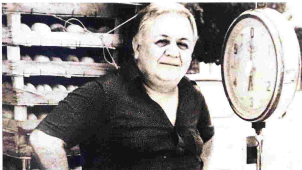
»»» «Η Δημαγωγία και ο Λαϊκισμός είναι η καταστροφή μας. Ο φασισμός κι ο απηδαστικός αυγιατισμός. Δεν υπάγχει καμιά ελπίδα για καλύτερη ζωή αν συνεχίσουμε έτσι...»

Η επόμενη μέρα δεν θα 'ναι σαν την προηγούμενη! Και κάνουν λάθος όσοι ελπίζουν πως η απόφασή τους αυτή θα είναι απλώς μιά σαν όλες τις προηγούμενες και η ζωή θα συνεχίσει να κυλάει κανονικά, σ' ένα "πάμε σαν άλλοτε" με φίλους, γνωστούς, γκαρδιακούς και μη, και με τις συνήθειες, καθημερινές ασκήσεις ιλαρού ελεύθερου χρόνου: Στους κολλητούς και στις παρέες, εκεί δηλαδή όπου ο καθένας καταφεύγει στο τέλος τέλος για να αντλήσει