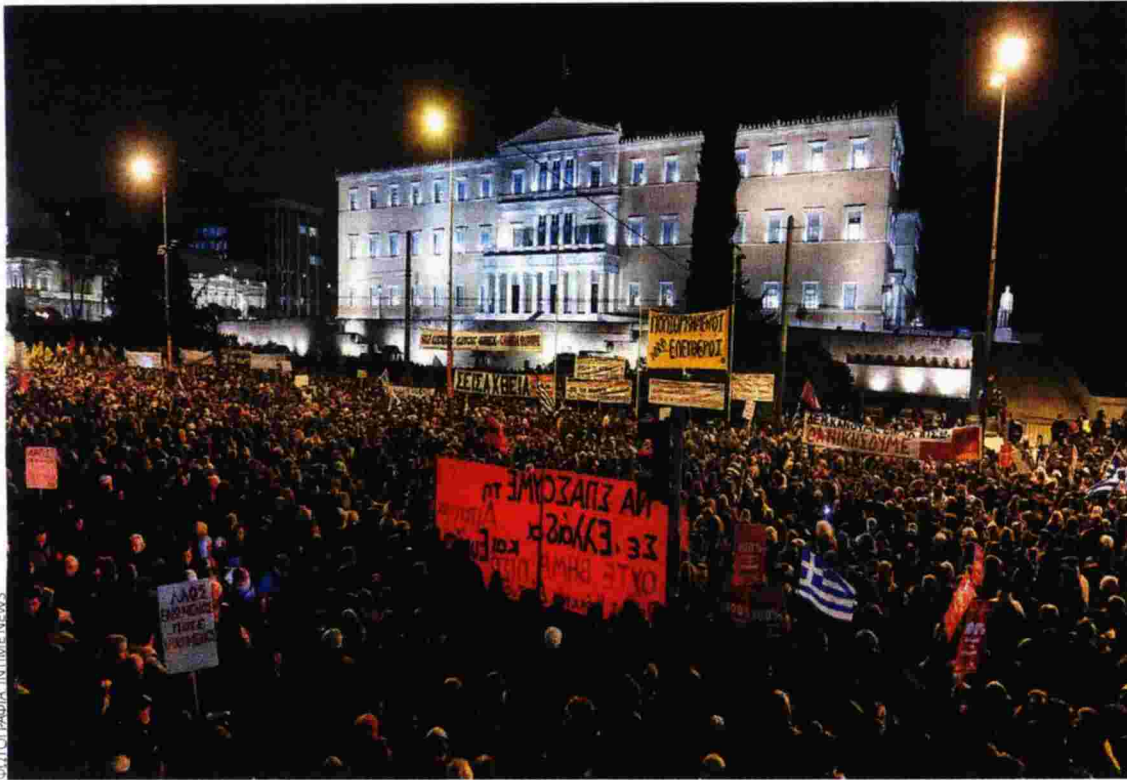
Η συγκέντρωση της Τετάρτης στο Σύνταγμα την ώρα που συνεδριάζε το Eurogroup στις Βρυξέλλες

θεση, εκεί που εγκαινιάστηκε αυτό που σήμερα ονομάζουμε λιτότητα. Δεν δικαιούμαστε λοιπόν να εφησυχάζουμε. Από τη στιγμή που η Ευρώπη αρχίζει και κινείται με «επισημως» πολλαπλές ταχύτητες, από τη στιγμή που μπορεί ήδη να μιλάμε για Νότο εναντίον του Βορρά, από τη στιγμή που οι αποφάσεις λαμβάνονται από παγιωμένα εξουσιαστικά διευθυντήρια, το όνειρο της ενσωμάτωσης χάνει το νόημά του. Η εξουσία ασκείται πλέον μέσω αυθαίρετων τεχνοκρατικών αυτοματισμών. Και τότε όλα μπορεί να συμβούν.