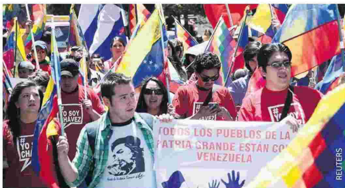
Φίλοι της Βενεζουέλας οργανώνουν πορεία στήριξης του Μαδούρο στη Λα Παζ της Βολιβίας. «Όλοι οι λαοί του μεγάλου έθνους (σ.σ.: δηλαδή της Λατινικής Αμερικής) είναι με τη Βενεζουέλα», γράφει το πανό, ενώ ακούστηκαν και συνθήματα κατά του «αμερικανικού ιμπεριαλισμού».

ΓΙΑΝΝΗΣ ΠΑΠΑΔΑΤΟΣ jpapadatos@e-typos.com