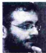
ΤΟΥ ΚΩΝΣΤΑΝΤΙΝΟΥ ΖΑΓΑΡΑ

γίες των ευρωπαϊκών λαϊκών μαζών. Η εικόνα της Ε.Ε. είναι εικόνα ενός κόσμου που θρυμματίζεται και αφήνει τα συντρίμια του πάνω στις ανθρώπινες σάρκες. Κανείς δεν είναι σε θέση να υποστηρίξει πως η Ε.Ε. αποτελεί πολιτική οντότητα ή πολιτισμική ενότητα. Επίσης η επίκληση μιας ευρωπαϊκότητας και μιας κοινής ευρωπαϊκής ταυτότητας μοιάζει τουλάχιστον αυθαίρετη.