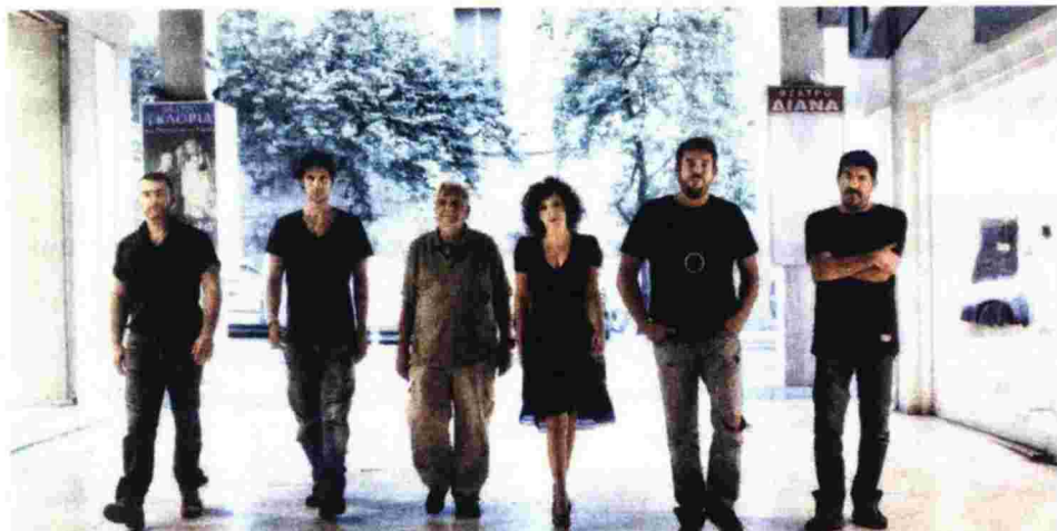
Οι συντελεστές της παράστασης «Κατάδικός μου», η οποία ξεκίνησε ήδη περιοδεία.