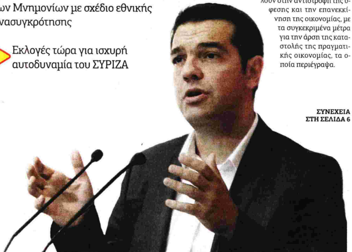
ΣΥΝΕΧΕΙΑ ΣΤΗ ΣΕΛΙΔΑ 6

Και από την άλλη θα συμβάλουν στην αντιστροφή της ύφεσης και την επανεκκίνηση της οικονομίας, με τα συγκεκριμένα μέτρα για την άρση της καταστολής της πραγματικής οικονομίας, τα οποία περιέγραψα.