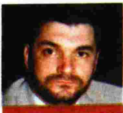
ΑΠΟ ΤΟΝ ΦΑΗΛΟ Μ. ΚΡΑΝΙΔΙΩΤΗ ΔΙΚΗΓΟΡΟ http://www.antinews.gr