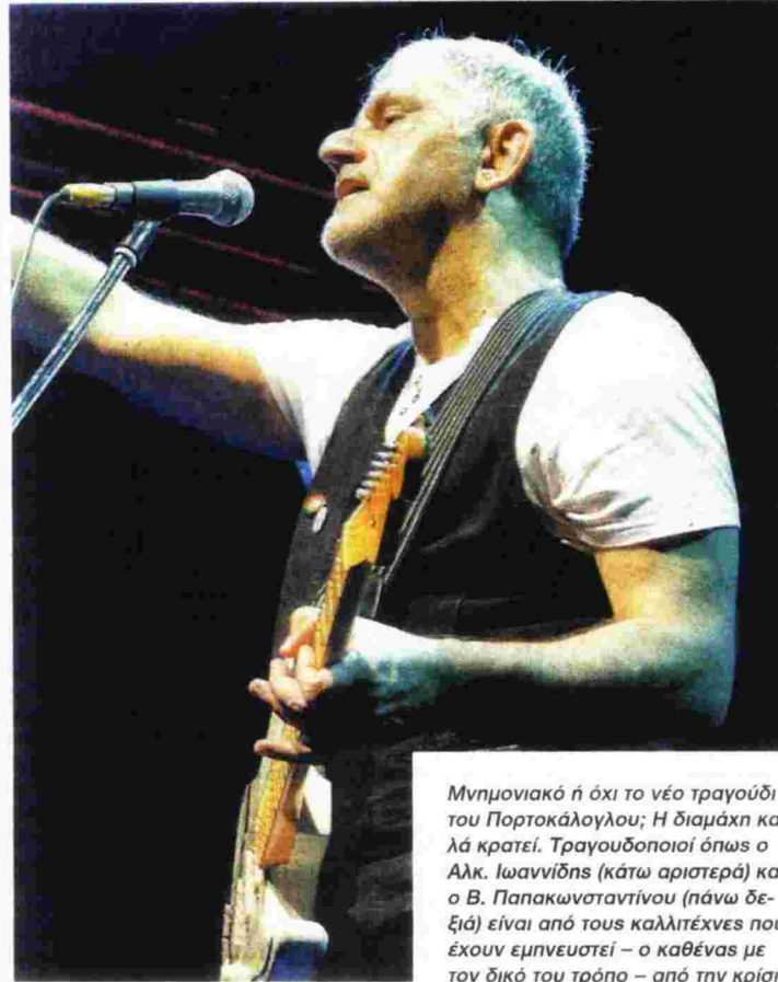
Μνημονιακό ή όχι το νέο τραγούδι του Πορτοκάλου; Η διαμάχη καλά κρατεί. Τραγουδοποιοί όπως ο Αλκ. Ιωαννίδης (κάτω αριστερά) και ο Β. Παπακωνσταντίνου (πάνω δεξιά) είναι από τους καλλιτέχνες που έχουν εμπνευστεί – ο καθένας με τον δικό του τρόπο – από την κρίση