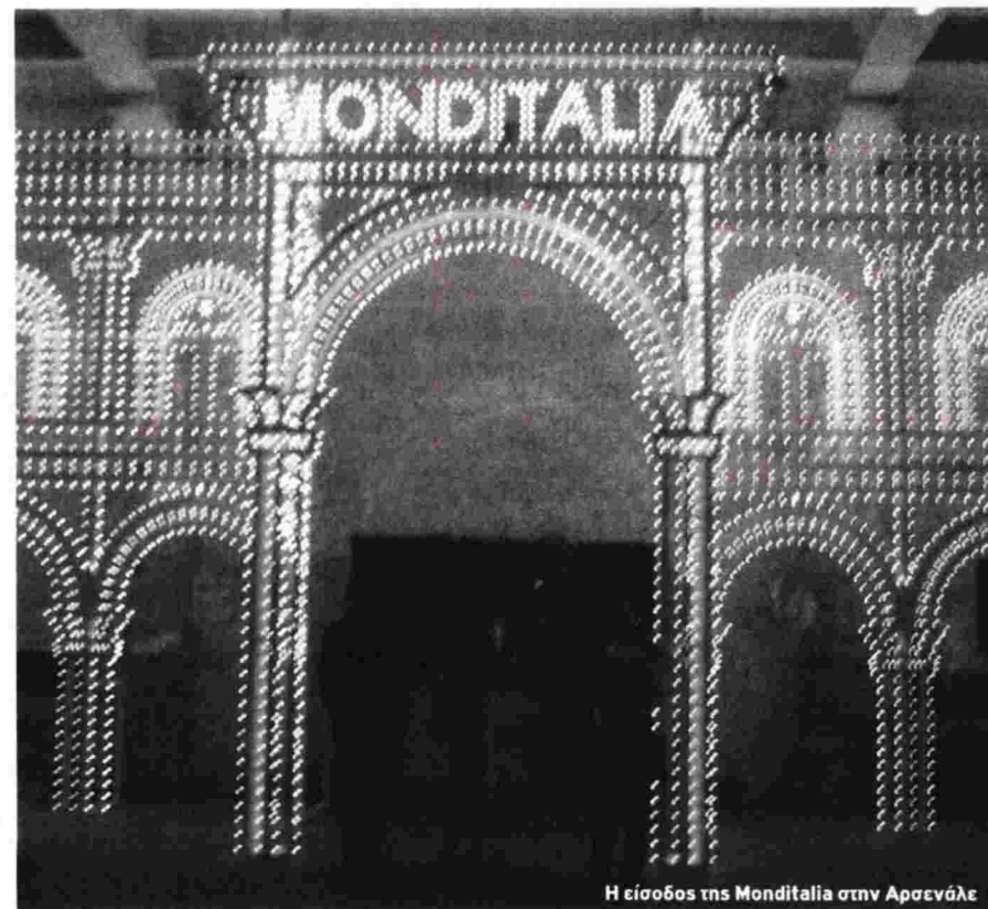
Η είσοδος της Monditalia στην Αραρνάλε

Αριστερά και λαϊκότητα, «μορφή» και «περιεχόμενο»