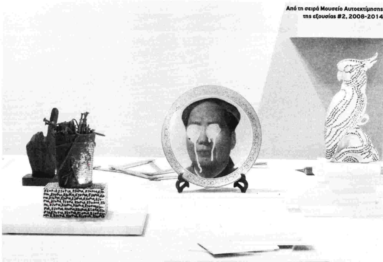
Από τη σειρά Μουσείο Αυτοεκτίμησης της εξουσίας #2, 2008-2014

Παράδοξο της εποχής μας: ενώ το κοινωνικό πεδίο αποβαίνει εξόχως εκρηκτικό, η ευρωπαϊκή Αριστερά βλέπει την απήκηση της να κάμπτεται. Με εξαίρεση την Ισπανία και Ελλάδα, η ευρωπαϊκή Αριστερά βρίσκεται σήμερα σε υποχώρηση. Στην Γαλλία, επισείεται το ενδεχόμενο «ιστορικό τέλος» της. Η σοσιαλιστική πλευρά βρίσκεται ήδη σε αποσύνθεση, ενώ η Αριστερά της Αριστεράς αδυνατεί να ακουστεί στην πολιτική σκηνή. Αναμφισβήτητο ότι οι πολιτικοί σχηματισμοί της Αριστεράς, είτε της επαναστατικής είτε της μεταρρυθμιστικής πτέρυγας, χάνουν την γοητεία τους, ιδίως μεταξύ των νέων, δεν συναρπάζουν την κοινωνία. Ωστόσο, είναι εξ ίσου αναμφισβήτητο ότι η κοινωνία δεν παραδίδεται, αλλά βυθίζε-